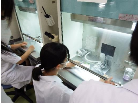
A：やさしいバイオ体験

本校生徒も体験のサポートをさせてもらい、熱中症に気を付けながら、安全に楽しく本校の学習活動の一端を知ってもらうことができたように思います。