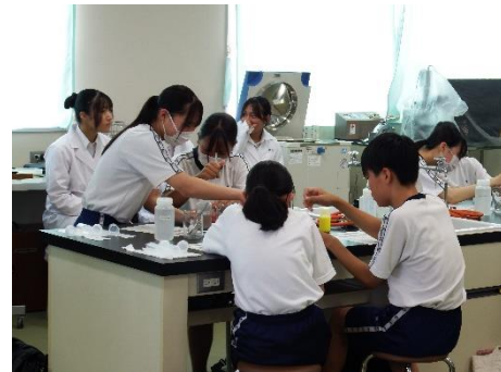
F：パンのふくらむ仕組み