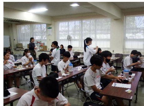
H：バターのおいしさ

午前・午後ともに2回目の体験を終えた後、遠方からの参加で関心のある生徒や保護者の方を対象に、寄宿舎の説明会も行いました。