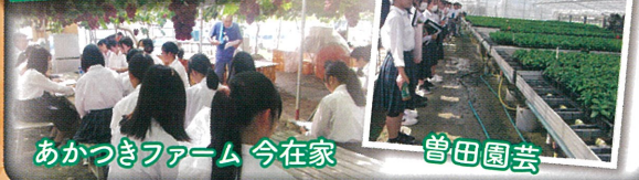
あかつきファーム 今在家