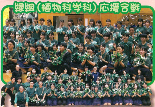
緑組(植物科学科)応援合戦