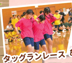
タッグランレース