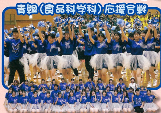
青組(食品科学科)応援合戦