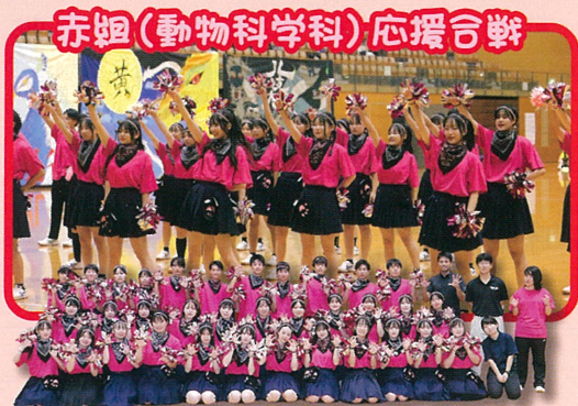
赤組(動物科学科)応援合戦