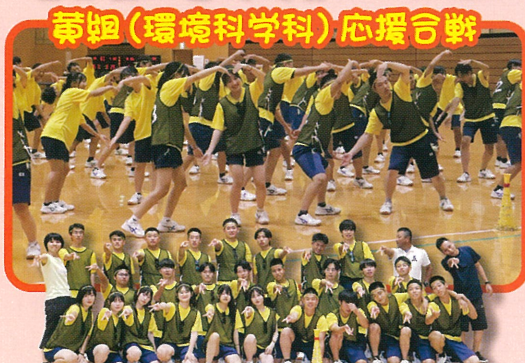
黄組(環境科学科)応援合戦